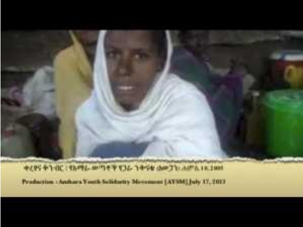
መሳም፤ ልጅ ማቀፍ ይፈልጋሉ።

“እሱ ቢልልኝማ መውለድ እፈልጋለሁ” ስትል የተማጽኖ ምላሽ ትሰጣለች። ሌላዋ “በቀን አስር ሊትር ጸበል እጠጣለሁ” በማለት ትናገራለች። የተቀሩት ሁሉም “በሽታ ገብቷል ብለው በግድ ከተቡን” ይላሉ። ሁሉም የአማራ ክልል ነዋሪዎች ናቸው። የተሰባሰቡት ሩፋኤል በሚባል ጸበል ስፍራ ነው። ዓመትና ሁለት ዓመት የተቀመጡ አሉ። ሁሉም ወልዶ