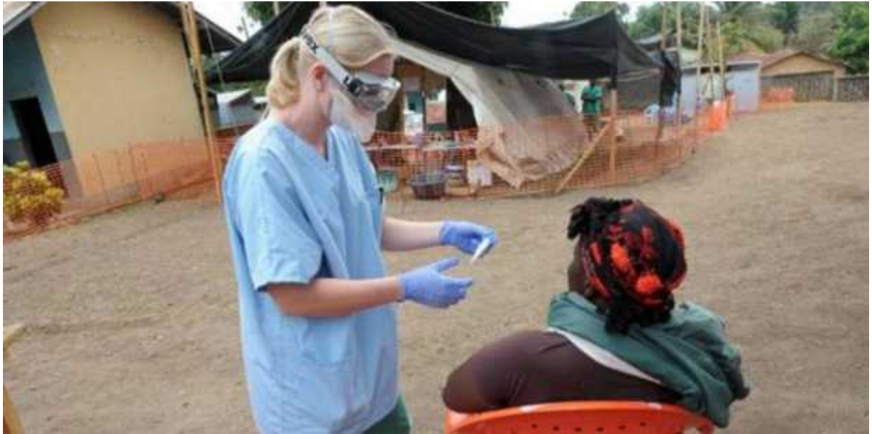
November 13, 2014 12:28 am

በተለያዩ ወቅቶች የሰውን ልጅ ከእንስሳ በማሳነስ የተፈጸሙ ወንጀሎች ስለመኖራቸው መረጃዎች ይወጣሉ። በቤተ ሙከራ ውስጥ የሚፈበረኩትና ሆን ተብለው እንዲሰራጩ የሚደረጉት የበሽታ መነሻዎች የክቡር ሰው ልጆችን ህይወት በሚዘገገን ሁኔታ አራግፈውታል ። አባት፣ እናት፣ ልጅ፣ የልጅ ልጅ፣ አልፎ ተርፎ ትውልድ ... የሰው ልጅ በሽታ ኢንቨስት ተደርጎበት፣ የሕዝብ ብዛት መቀነሻና የባዮሎጂካል ጦር መሣሪያ መመራመሪያ ተደርጓል፣ አሁንም እየተደረገ ነው፤ የበሽታ ማምከኛ መሞከሪያና ማፈላለጊያ ሆኖ ኖሯል። ዛሬም እየኖረ ነው ። የሌላውን አገር ሕዝብ ከህይወት በታች፣ የራሳቸውን ግን ድርብ ህይወት እንዳላቸው አድርገው የሚቆጥሩት ምዕራባውያን እንደመልካቸው ለማሳመር የሚሞክሩት ታሪካቸው ለማመን የሚያስቸግር እና ለመቀበል የሚከብድ ፍትሕ ያልተሰጠባቸው “ወንጀሎች” አካሂደዋል፤ አሁንም በረቀቀ መንገድ እያካሄዱ ነው ። በዚህ መነሻና እሳቤ ይመስላል ኢቦላን ለድሆች የቀረበ የወረርሽኝ ኢንቨስትመንት እንደሆነ አድርገው ለጉዳዩ ቅርብ የሆኑ እየተቹ ያሉት።