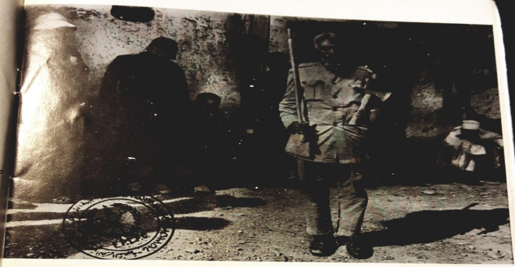
ገደብ ወር 3 ደብዳቤ ገዛና መገናኛ + ወይንና ደብዳቤ ሰውና ቀደሚያ ::