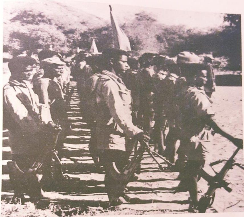
ሰው ልዩ ልዩ ለባህር ላይ ለመሄድ ለሚያገለግሉ ሰዎች - ህ.ጥ.ጥ.ጌ